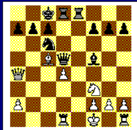
Zwart begint en wint. Diagram 8