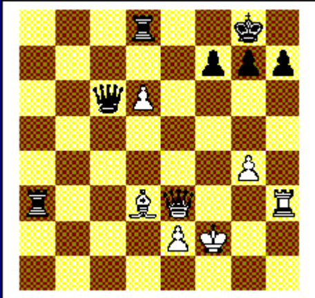
Wit begint en wint. Diagram 5