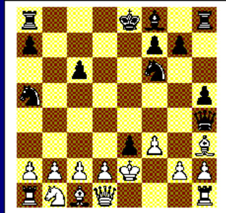
Zwart begint en wint. Diagram 6