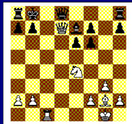
Wit speelt en wint. Diagram 10