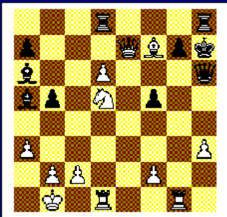
Wit speelt en wint. Diagram 7