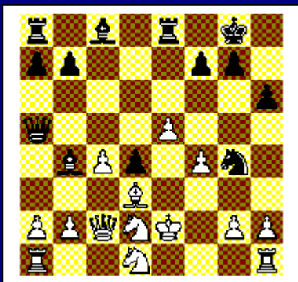
Zwart speelt en wint. Diagram 9